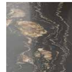
Quarzit dunkel Quartzite dark