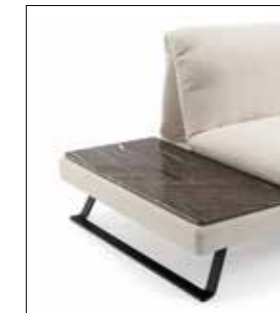
Granit braun Granite brown