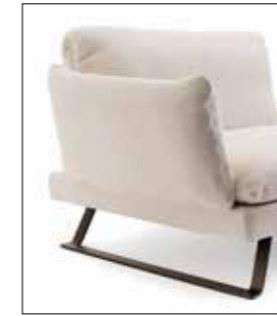
Kufe Metall in bronze matt Skid metal in bronze matt