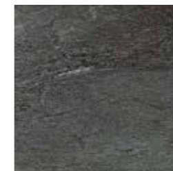
Granit schwarz Granite black