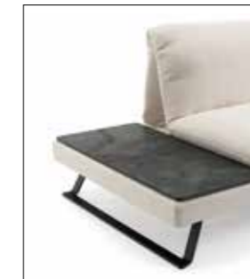
Granit schwarz Granite black