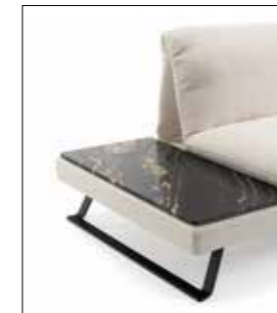
Quarzit dunkel Quartzite dark