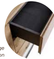
Schubladen als Vollauszüge mit Tip-on Funktion