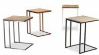
Beistelltisch kuub • B 40 T 45 H 58