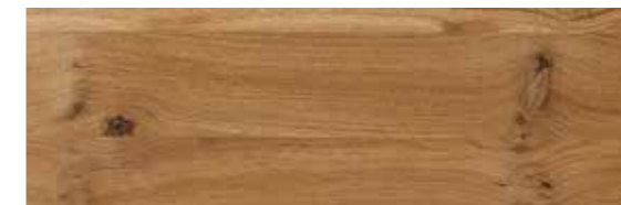
Eiche natur geölt