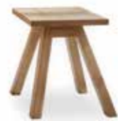
Hocker • B 36 T 36 H 45 cm