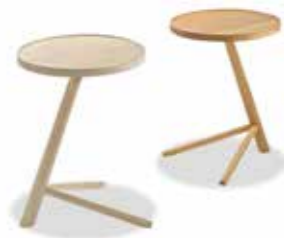
Beistelltisch Mikado • D 45 H 62 cm • 2 Türen 1. Schublade • Doppeltür ohne Mittelseite • 1 Boden