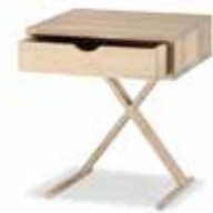
X-Tisch • B 50 T 40 H 58 cm • Mit und ohne Schubfach lieferbar