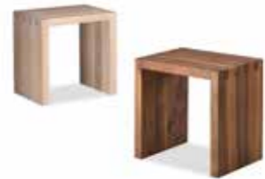
Hocker • B 45 T 35 H 45,5 cm • Verarbeitung: gezinkt