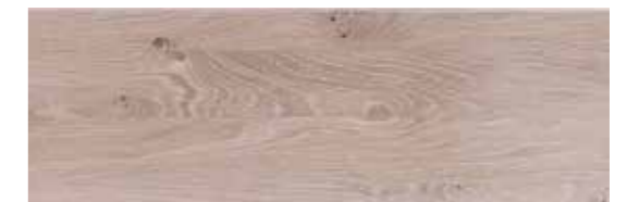
Eiche weiß geölt

Glas: Klarglas, Parsolglas in grau. Satiniertes Glas in grau, anthrazit und weiß hinterlackiert. Wunschfarbtöne sind möglich.