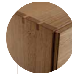
Der Korpus wird in traditionell handwerklicher Zinkenverbindung gearbeitet